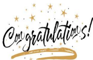
Imagen 5

Felicitaciones estimado aprendiz, luego de haber construido toda una serie de conocimientos teóricos, en conjunto con sus compañeros e instructor, es momento que demuestre todo lo que ha asimilado acerca de esta Guía. Por lo tanto, desarrolle el taller práctico “DIRECCIONAMIENTO ESTRATÉGICO” propuesto por su instructor dando respuesta a su proyecto formativo y consérvelo dentro de su portafolio de evidencias. Este atento a la estrategia de revisión y valoración que plantee su instructor.